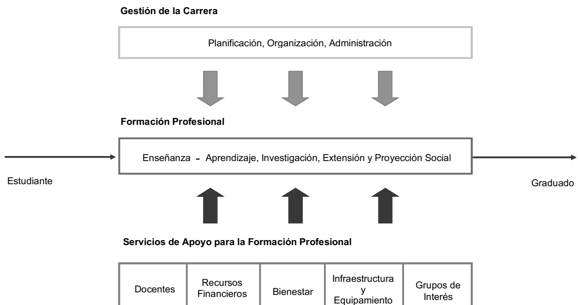
Figura 2: MODELO DE CALIDAD PARA LA ACREDITACIÓN DE CARRERAS PROFESIONALES UNIVERSITARIAS.